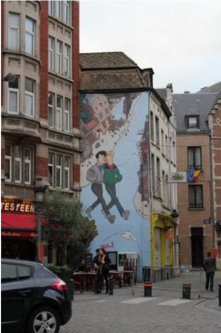
Tegneren bag Tintin kommer fra Belgien