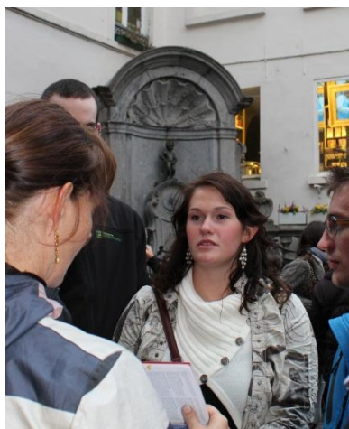
Vartegnet Manneken Pis fandt vi på et hushjørne