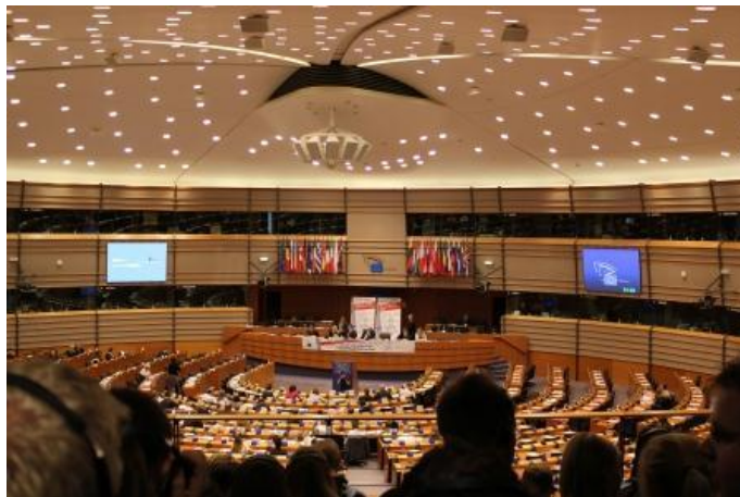
Plenarsalen i Europa Parlamentet, hvor de mundtlige høringer finder sted.

I forhallen i Europa Parlamentet finder vi denne store skulptur, der illustrerer det komplekse samspil, der er mellem EU's medlemslande.