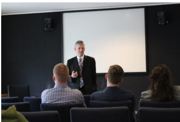
MEP George Lyon

George Lyon fortalte om de sager, parlamentet arbejder med lige nu. I den senere tid har det været forslaget til den nye CAP reform, der har været diskuteret og arbejdet med. I forslaget til CAP reformen fokuserede George Lyon særligt på hjælpen til unge landmænd i etableringsfasen og den grønne del af reformen, der