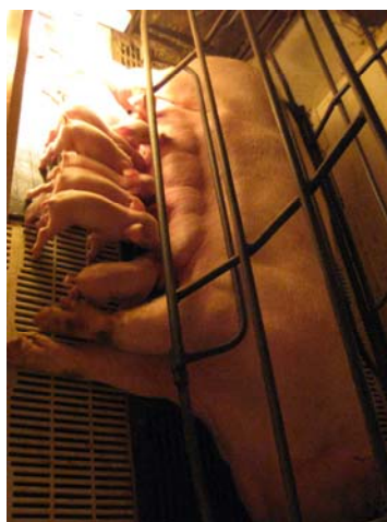
Foto 6 og 7. Indtryk fra farestalden.

Søerne flyttes først ind cirka 2 dage før faring og diegivningstiden er cirka 19 dage. Halekupering er det ikke regler omkring og der sås mindre end ¼ del tilbage for at undgå halebid. Der sås skuldersår sås ved en del søer og der var ikke krav om behandling. Farebøjlen havde ingen indstillingsmuligheder.