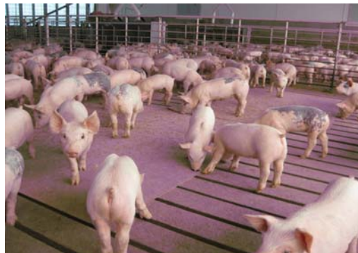
Foto 4 og 5. Eksempel på FRATS-stald med gardinventilation og gulvudsugning.