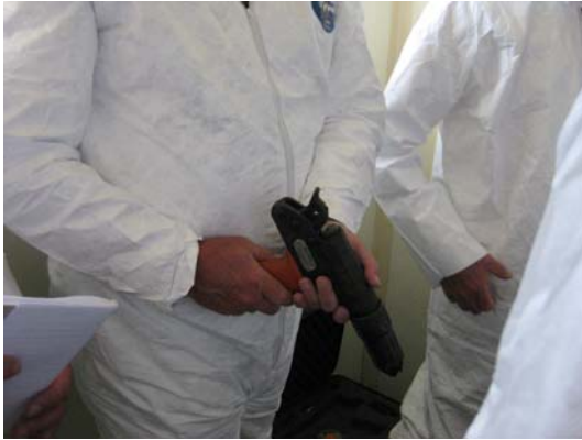
Foto 10. Aflivning - en ny type boltpistol er udformet som et almindeligt våben. Aflivning af pattegrise vil i nærmeste fremtid blive ændret til gasning.

I forbindelse med besøget på Pipestone Veterinary Clinic besøgte vi både en smågrise- og en slagtesvineproducent.