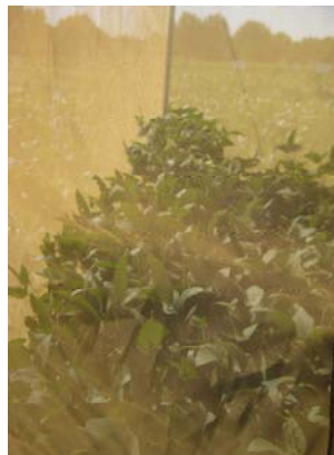
Foto 18. Soja uden resistens for Looper.

Ifølge Smithfield, Murphy Brown og Pioneer er GMO generelt ikke et spørgsmål, som forbrugerne i USA tager aktivt stilling til. Enten er de ligeglade eller har accepteret brugen af GMO i afgrøder og dermed også foder og fødevarer. Det er en anden situation i Europa. Europæere bryder sig ikke om GMO, og derfor bruger Pioneer molekylære markører for at forædle sorter til det europæiske marked i stedet for GMO. Dog anvender både Spanien og Portugal hybrider, som besidder resistens over for visse skadelige insekter.