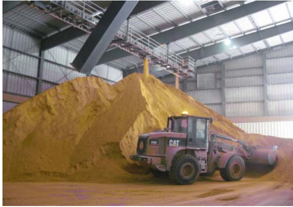
Foto 14. Bunke med DDGS som er et restprodukt fra ethanolproduktionen.

"Afdækning" af foder sker i stor stil i futures på børsen som senere ændres til fysiske varer, hvor der laves aftale med foderstoffirmaerne for 3-4 måneder ad gangen.