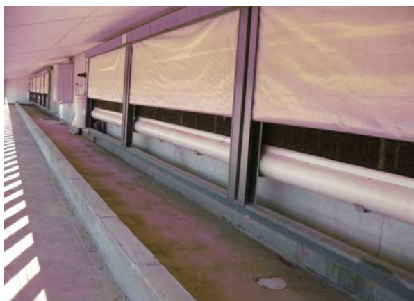
Foto 13. I forbindelse med luftindtaget i stalden til søer etableres der filtre i forbindelse med forebyggelse af PRRS (filtre monteres på rækken af funda-blokke til venstre i billedet).

PRRS koster 114 $ pr. so pr. år. Derfor er man i gang med at etablere sobesætninger, hvor alt indsugningsluften filtreres gennem et filter, så man kan eliminere PRRS efter Scott Dee's anbefalinger.