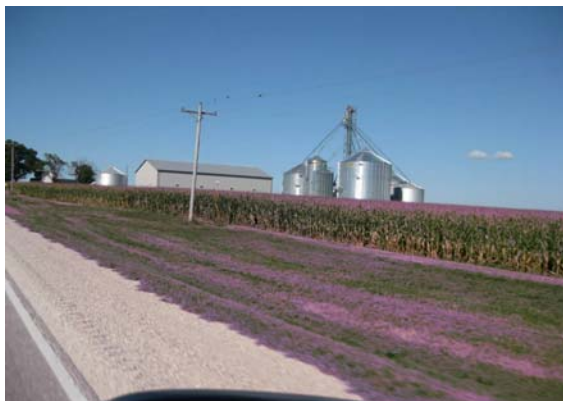
Foto 16. Eksempel på besætning med siloer til majs og soja.

Ligesom vi kender det i Danmark produceres stort set al foderet ud fra et normsæt, og de næringsstoffer, der ikke koster ret meget overforsynes med 20-25 pct., mens dem der koster noget holdes på normen.