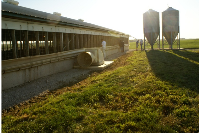
Foto 19. Gulvudsugning hindrer svovlbrinteforgiftning i stalde med gyllekældre.

CO 2 -udledning bruges der en del forskningsmidler på, hvilket vi i relation til svineproduktion synes var lidt spildt, fordi kun 0,35 pct. af den samlede CO 2 -udledning kommer fra svineproduktionen. Det ville nok give mere at kigge lidt på amerikanernes valg af bilstørrelse.