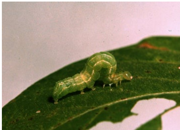
Foto 17. Soybean Looper

Pioneer har også mange GMO-SB med resistens overfor forskellige skadedyr og sygdomme. På Foto 18 var der lukket minimum 500 "Looper"-larver ind i teltet og hullerne i bladene viste tydeligt, hvilke hybrider der ikke var resistente.