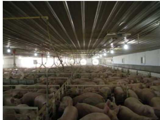
Foto 12. Indtryk fra slagtesvinestalden: Arealkrav som i Danmark. I hver sektion er der cirka 750 grise. Der er en sygesti pr. sektion med plads til 8-10 grise. Her samles dyr med dårligt ben, brok m.m. Stien er indrettet med fuldspaltegulv og ingen strøelse/afkastning. Ingen smertebehandling og alle dyr kan leveres til slagteriet.