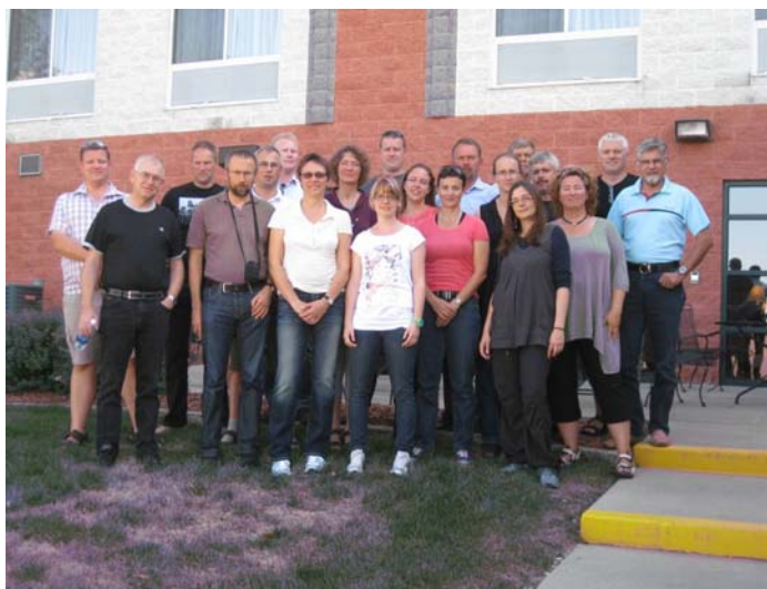
Foto 1. Deltagerne i studieturen til Iowa, USA 2011

Programmet for turen fremgår af bilag 1. Rapporten er udarbejdet af deltagerne på turen - deltagerlisten fremgår af bilag 2.