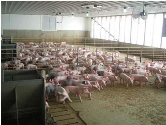
Foto 11. Indtryk fra FRATS-stalden: Rigtig pæne, nyindsatte 19 dage gamle fravænnede grise som var meget ens. Antibiotika tildeles i foderet. En enkelt sti holdes tom ved indsættelse så små og syge grise kan samles her. Lav dødelighed.

I forbindelse med besøget på Pipestone Veterinary Clinic besøgte vi både en smågrise- og en slagtesvineproducent.