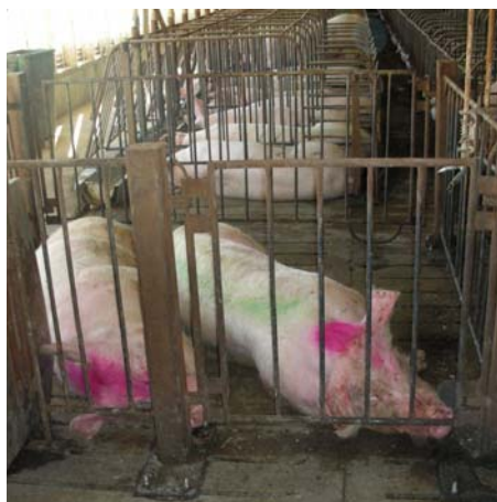
Foto 8 og 9. Indtryk fra drægtighedsstalden – søer i boks og sygesti - boksene var meget små i forhold til størrelsen på søerne. Der var to sygestier med plads til i alt 4-6 søer. Fuldsaltegulv og ingen strøelse.