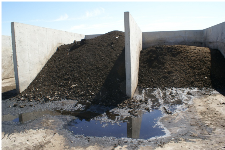
Foto 20. Komposterings-siloer til døde dyr i stor sobesætning. Savsmuldet har været genanvendt i foreløbig 7 år.

Der skal ikke gøres rede for opbevaring af døde dyr. Disse komposteres på den enkelte ejendom i større kompostsiloer. De døde dyr ligges i siloen og dækkes med savsmuld som jævnligen vendes rundt med en rendegraver eller lignende. Vi så et eksempel på en sådan komposterings-silo og selv forholdsvis tæt på, var der meget lidt lugt.