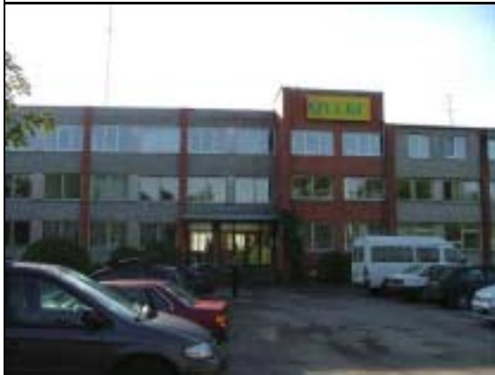
De regionale distrikter