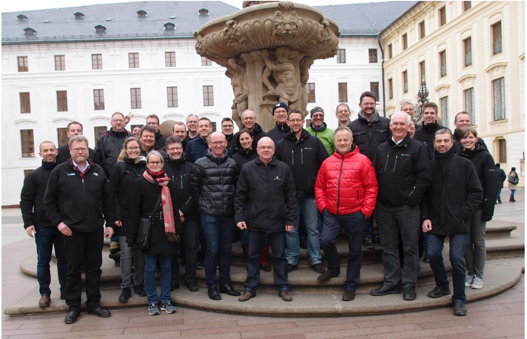
Bygningskonsulentforeningens nytårskur blev i 2015 afholdt som studietur til Prag & omegn, Tjekkiet