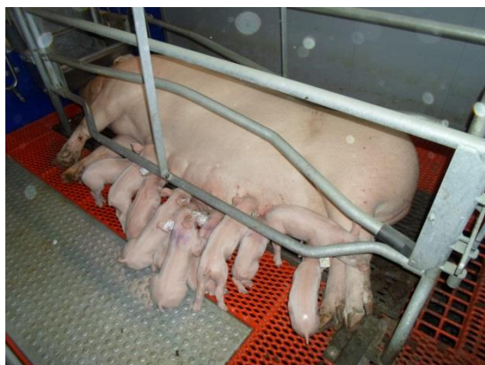
Farestier med fuldspaltegulv

Der anvendes indkøbt færdigfoder og der er fem forskellige foderstoffirmaer indenfor 20 km radius, så konkurrencen mellem firmaerne gør, at indkøbt foder er økonomisk fordelagtigt.