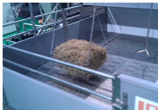
Beskæftigelses- og rodematerialer