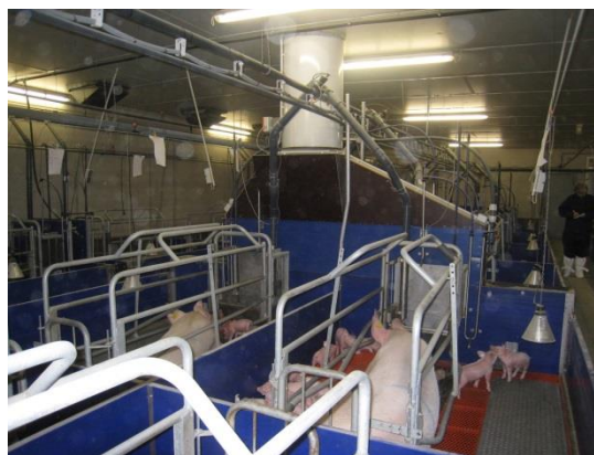
Luftrensere i farestalden