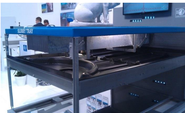
Gyllesystemer til fuldspaltegulvstier