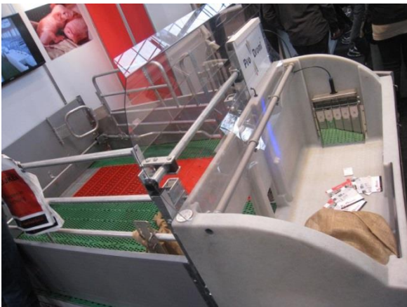
Faresti til løsgående søer

De var mange indtryk på Euro Tier, og alle var overraskede over den store mangfoldighed. Der blev vist en bred vifte af muligheder inden for hver produkttype (fx farestier til løsgående søer). Det var også tydeligt, at Kina er en vigtig aktør i branchen. Der var også en hel del IT-værktøjer til løsning af daglige arbejdsopgaver i staldene (fx udvejning af slagtesvin, fodringsudstyr).