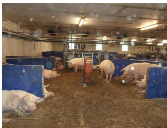
Drægtighedsstalden med ESF

Vaskehallen i Padborg ligger selvsagt tæt på grænsen og modtager lastbiler, der skal vaskes hele døgnet. Udgifterne dækkes af VSP. Vi fik et godt indtryk i de udfordringer der kan være med kunder fra hele Europa, der kan have en meget forskellig opfattelse af renlighed og rengøringsniveau! Endvidere fik vi en god indsigt i, hvor stor en indsats der gøres for