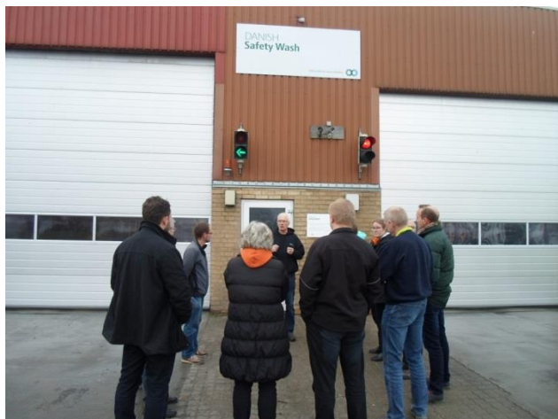
Danish Safety Wash i Padborg

at sikre, at der ikke kommer beskidte biler ind i Danmark, samt gode råd til hvordan vi som rådgivere kan øge fokus på dette, når vi besøger besætninger, der sælger dyr til udlandet.