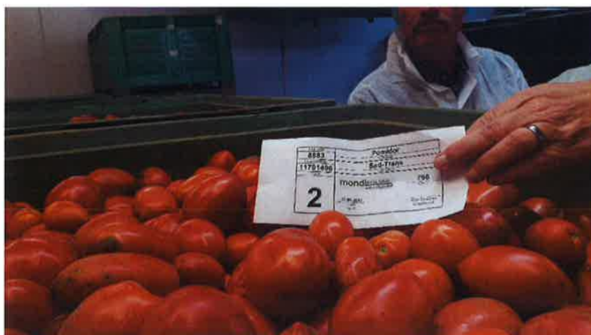
Tomater, der er klassificeret og med øvrige jord til bord oplysninger.

Alle råvarerne købes direkte på kontrakt fra landmændene. Kontrakten gælder dog kun leverance, da varerne typisk afregnes til dagspris. Ved levering går der straks en prøve til egen kvalitetsvurdering. Før landmændene kører fra fabrikken har varen fået kvalitetsstemplet og begge parter ved, hvad prisen bliver for det leverede. Temmelig stærkt koncept for begge parter.