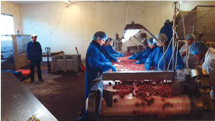
Jordbær på sorterebåndet.

Samtidig er der meget manuelt arbejde i processen fra frisk til frossen. I Danmark udfører fotoceller og anden automatik en langt større del af disse opgaver.