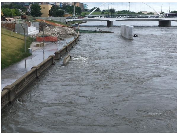
Billeder af Des Moines floden

Eftermiddag og aften blev tilbragt med åbning af konferencen, samt velkomstmiddag.