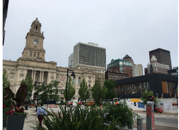
Billeder af et varieret gadeliv i Downtown Des Moines