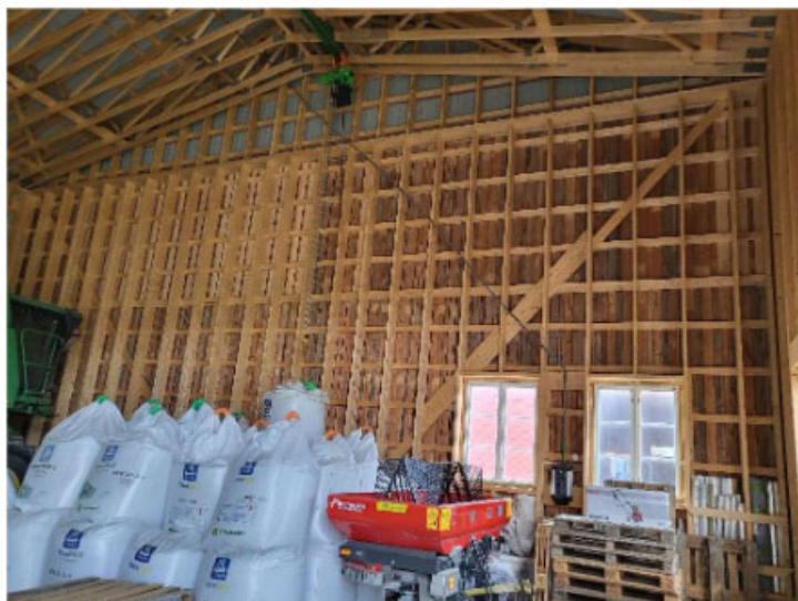
Trækonstruktionen i lade

En Lade bygning udført i træ og stålplader