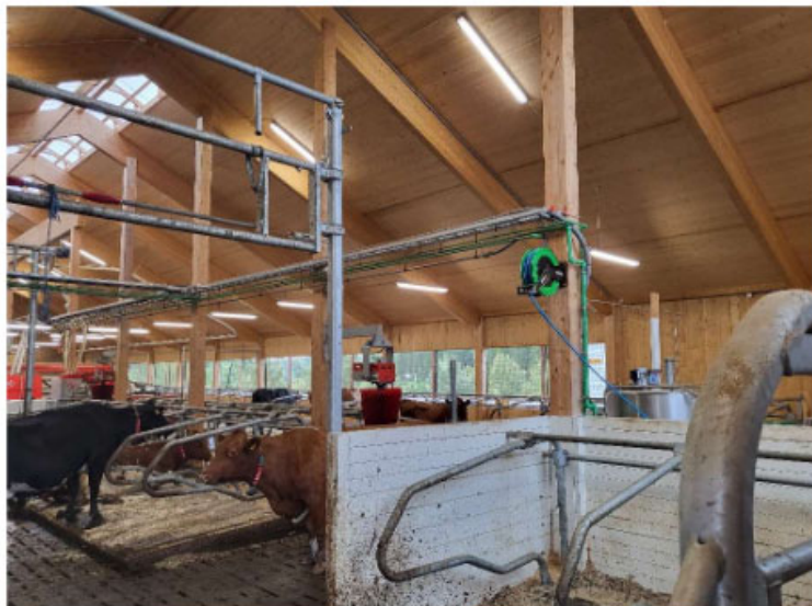
Inventar der kan hæves