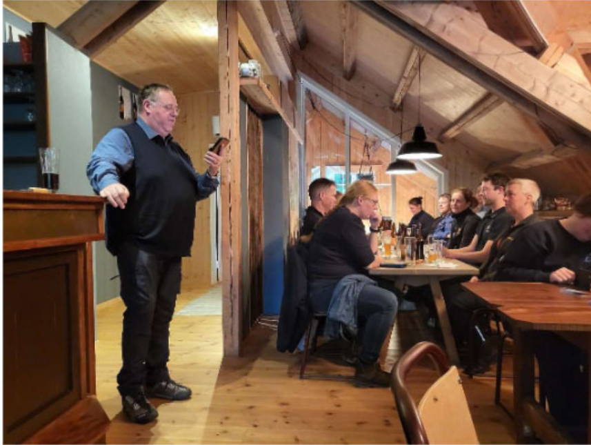
Ølsmagning på lokalt bryggeri