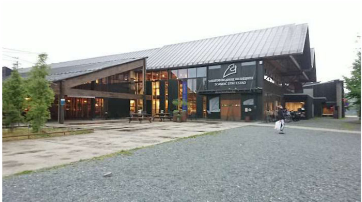
Hotellet Stiklestad Nasjonale Kultursenter