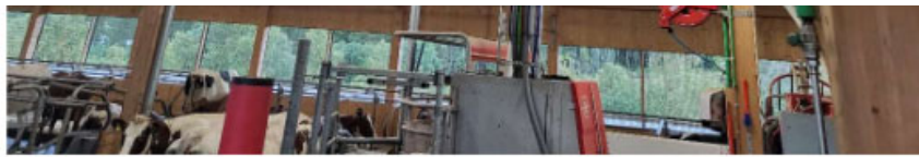
Løsning omkring robot, trækonstruktion