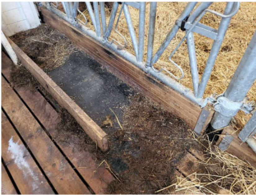
Eksempel på foderkrybbe udført i træ